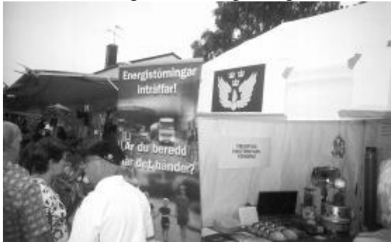
Civilförsvaret med mycket info och praktiska ting vid elavbrott

Söndagens arbetslag var i gång kl. 10, Civilförsvaret var på plats ganska snart efter, och sen gick det slag i slag.