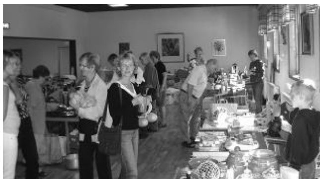
...och allmänna afdelningen