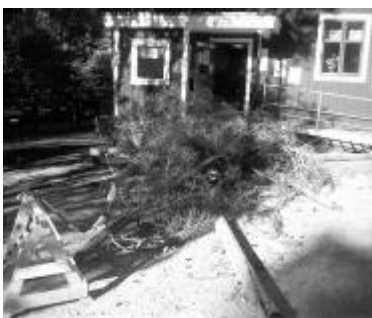
Pher och Olle fejkar stormfällning framför entrén