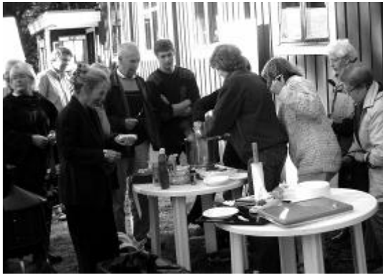
Ibland blev det kö till grytorna...