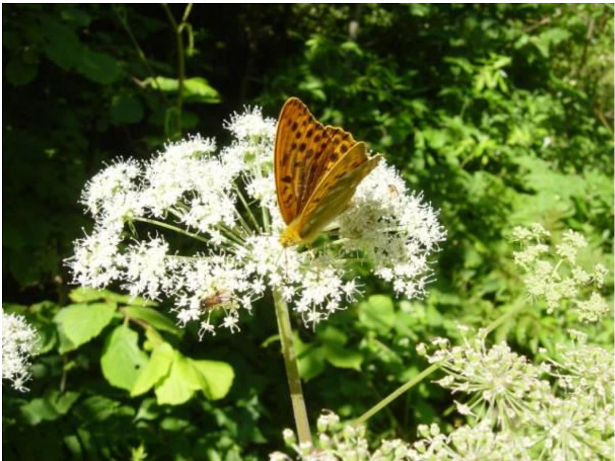
Kolla gärna bilden i färg på hemsidan / red.

Kanske har det funnits en ”trollmygga” eller en ”hummelbagge” i någon urskog?