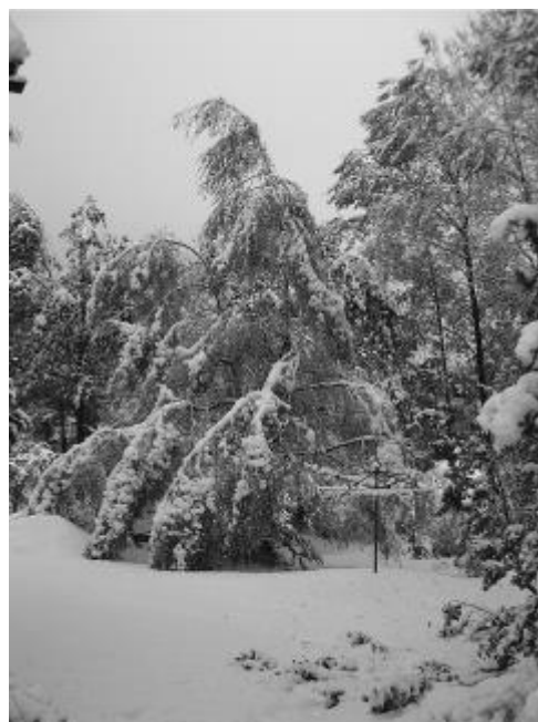
Bilder från 19 – 20 oktober 2002