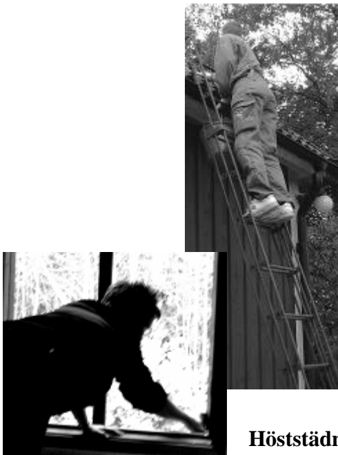
Höststädning i Bygdegården